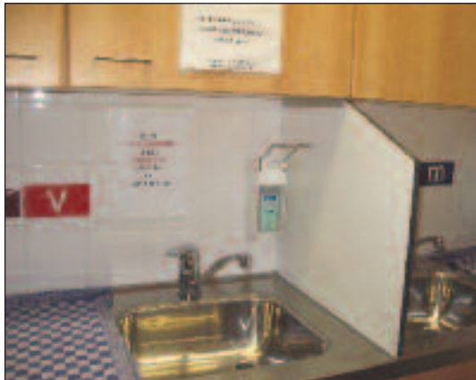
Die Geburtenstation, die sich nicht im jüdischen Flügel des Krankenhauses befindet, verfügt ebenfalls über eine koschere Küche.