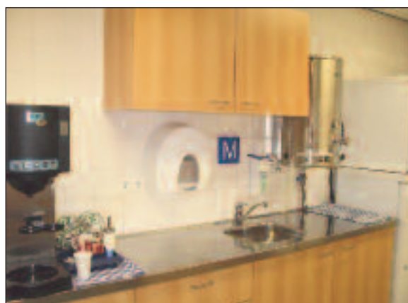
Die Küche ist streng kosher, die Waschbecken für Milch- und Fleischprodukte sind völlig voneinander getrennt.