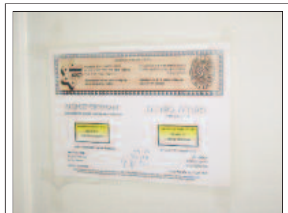
Kaschruth-Zertifikat für die Küchen des Krankenhauses.

Dafür gibt es mehrere Gründe. Zunächst befinden wir uns, wie ich bereits erwähnte, in einer Gegend mit einer dichten jüdischen Bevölkerung, was unseren Zusammenschluss mit der CIZ aus wirtschaftlichen Überlegungen gerechtfertigte. Es gibt jedoch einen noch wichtigeren Aspekt, nämlich die Identität des Spitals. Wir wollten uns durch etwas ganz Bestimmtes auszeichnen, was wir nie erlangt hätten, wenn wir uns einfach mit einem anderen allgemeinen Krankenhaus zusammengetan hätten. Auf diese Weise bleiben wir eine private Institution mit einem ganz spezifischen Merkmal.