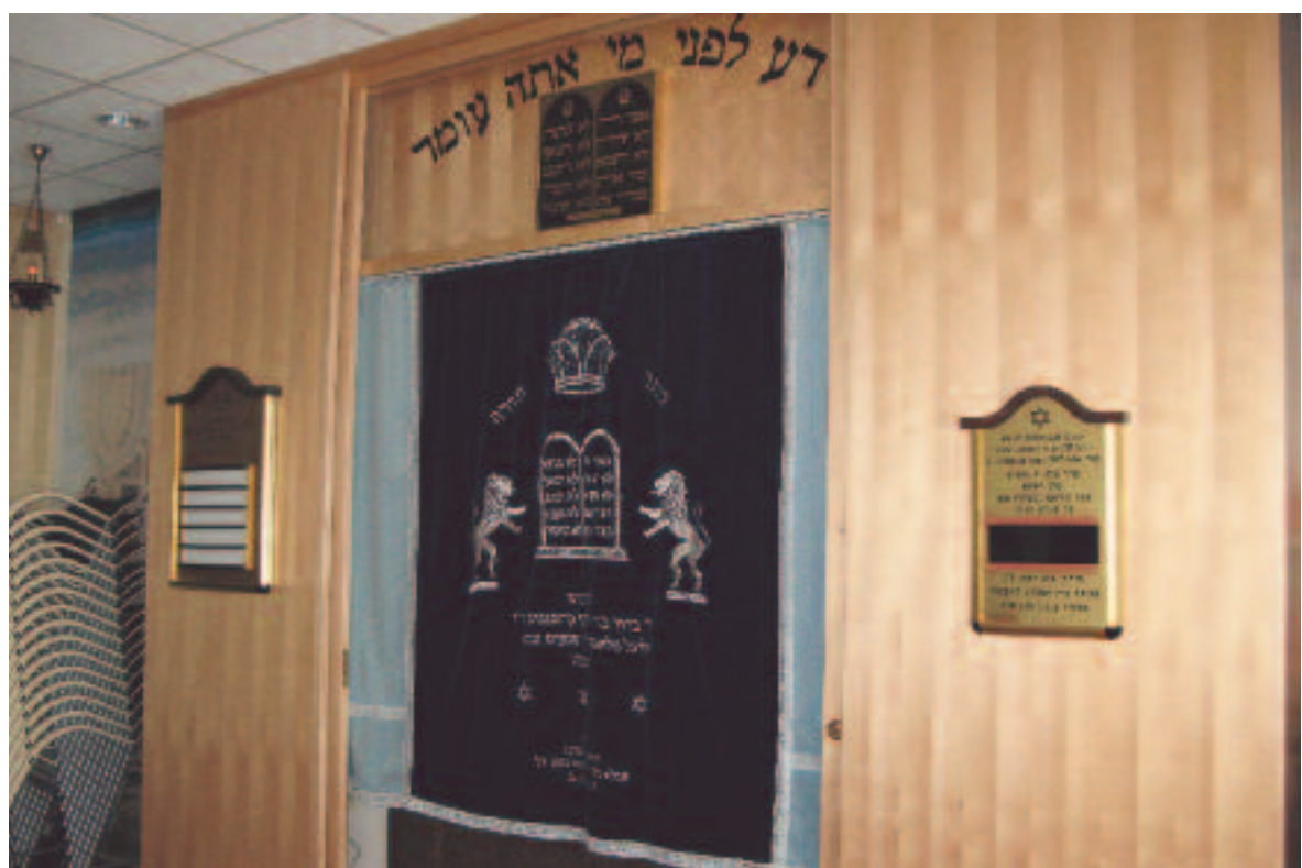
Die Bundeslade der Krankenhaussynagoge dient auch als Synagoge für das Quartier. Nicht selten werden Kranke in ihrem Bett hinunter gefahren, um zur Thora gerufen zu werden und dort einen „Mischeberach“ (Gebet für die Heilung) zu sprechen.