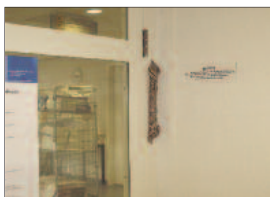
Ein in Europa einzigartiges Phänomen: zwei Stockwerke einer privaten Klinik sind ausschliesslich für jüdische Patienten reserviert. Am Eingang hängt eine Mesusah.

Wir verfügen heute über zwei Stockwerke (ca. 65 Betten), die für jüdische Patienten reserviert sind und gemäss den Vorschriften der Halachah geführt werden. In dieser Abteilung ist z.B. Euthanasie streng verboten. Unsere Kundschaft kann allerdings ihr Krankenhaus frei wählen (die einzige Einschränkung hängt von der jeweiligen Diagnose ab): ein Jude kann sehr wohl beschliessen, dass er in der allgemeinen Abteilung des Krankenhauses betreut werden möchte, so wie ein Nichtjude im jüdischen Flügel gepflegt werden kann. Letzterer muss sich dann bereit erklären, die geltenden jüdischen Vorschriften in Bezug auf Ernährung und Einhaltung des Schabbat sowie die Regeln der medizinischen Ethik nach jüdischer Gesetzgebung zu respektieren. Die Patienten können beispielsweise weder an Schabbat noch an jüdischen Feiertagen ein- oder austreten.